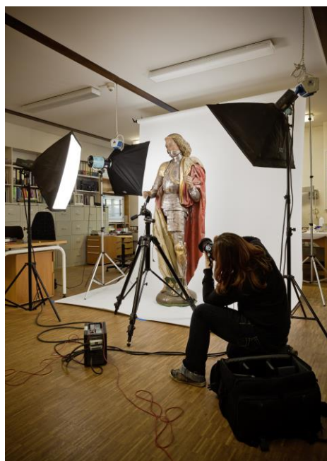
Séance photo d'une statue