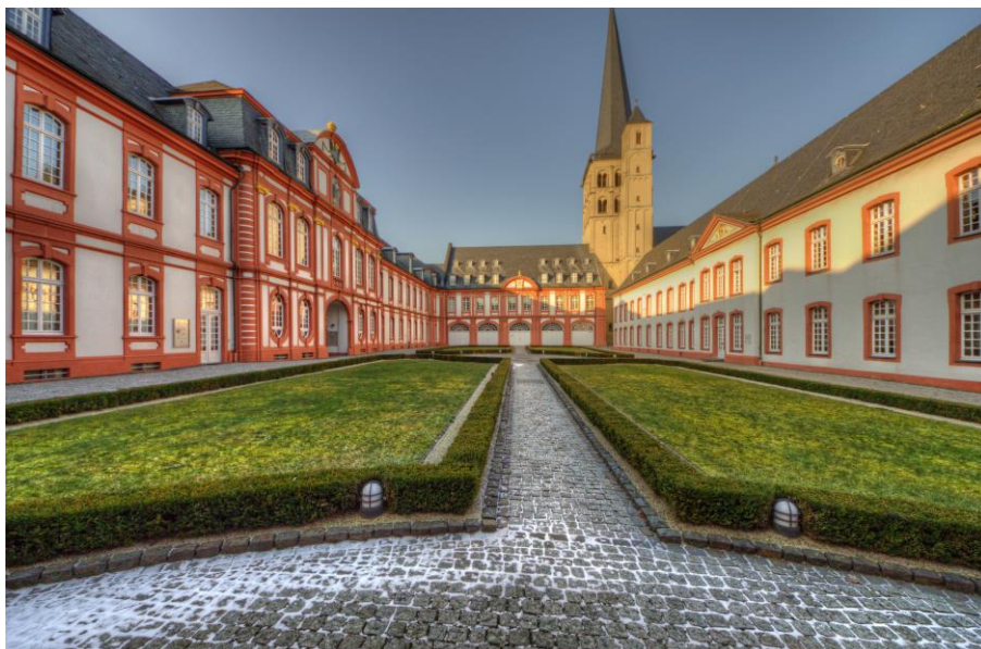
Bienvenue à l'abbaye de Brauweiler

Suite à des études d'histoire et à plusieurs expériences professionnelles dans le domaine culturel, il me paraissait logique de continuer sur cette voie. Si j'ai choisi cette organisation en particulier, c'est donc à la fois pour approfondir mes connaissances sur la protection du patrimoine tout en améliorant ma maîtrise de l'allemand. D'un autre côté, je dois avouer que le fait de partir à l'étranger me trottait dans la tête depuis déjà un certain temps... Le SVE me paraissait donc être un bon compromis pour concilier ces différents souhaits !